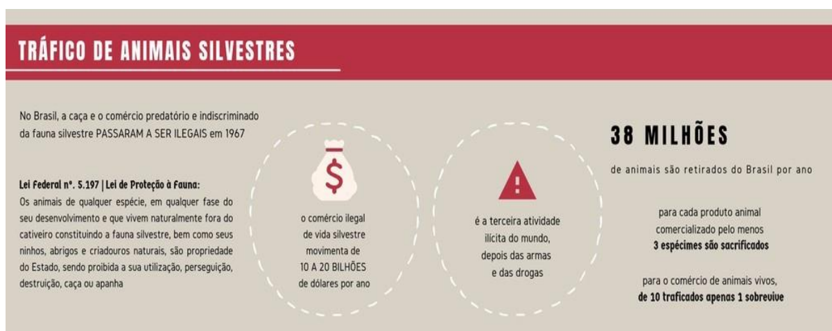
Figura 2 - Tabela de informações sobre o tráfico