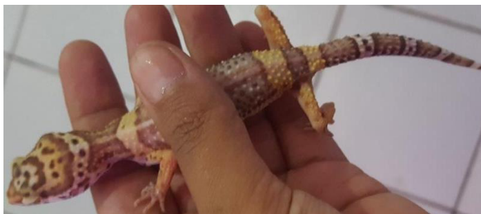
Figura 1 – Eublepharis macularius : animal com perda de gordura excessiva. Observe que a coluna vertebral está facilmente visível.