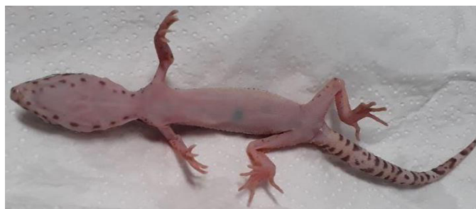
Figura 2 – Eublepharis macularius antes da autopsia. Observe que a calda não apresenta depósitos de gordura. Essa aparência é vulgarmente chamada de “Stick tail”, “rabo de pau”.

Foi tentando a alimentação forçada com uma ração em gel para répteis insetívoros, porém o animal regurgitava. Após 5 dias o animal veio a óbito e foi encaminhado ao Laboratório de Patologia Veterinária - LPV-UnB para realização da necropsia com suspeita de criptosporidiose. O animal estava em bom estado de conservação e foi encaminhado em menos de 24 horas ao laboratório.